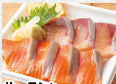
サーモンとブリの漬け丼 976円 (税込1055円) 漬け込むことで浑然一体となったサーモンとブリの旨みをお楽しみください