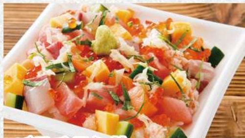
バラチラシ丼 915円 (税込989円) 色々な美味しさが広がるチラシ丼。まさに丼の玉手箱!