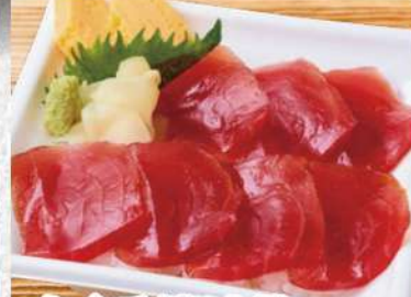
まぐろ漬け丼 803円 (税込868円) 特製醤油に漬け込んで、鯖のおいしさを存分に引き出しました