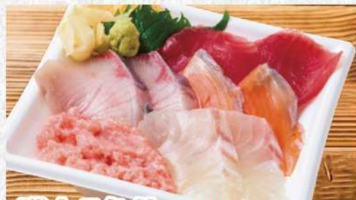
磯丸5色丼 1017円 (税込1099円) 一杯で味わう海鮮のメリーゴーランド!