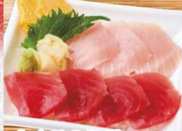
まぐろ2色丼 803円 (税込868円) 鯖赤身と、びんちょう鯖が、いっぺんに味わえる、磯丸人気No.1丼