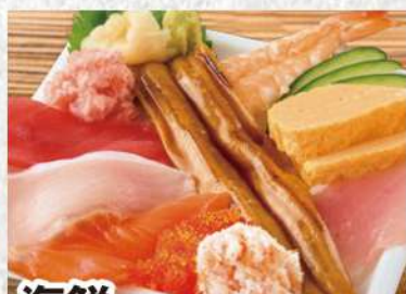
海鮮ごぼれ丼 1221円 (税込1319円) 丼からこぼれそうなほど、ネタを豪快に盛りました