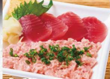
ねぎトロ丼 803円 (税込868円) 鯖赤身とねぎトロは、鯖好きにはたまらない黄金の組み合わせ