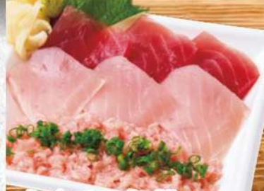
まぐろ3色丼 915円 (税込989円) 鯖を食べ尽くす! 赤身・びんちょう・ねぎトロ盛り