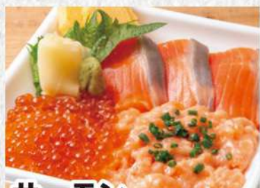
サーモン3色丼 1017円 (税込1099円) まさにサーモンづくし!