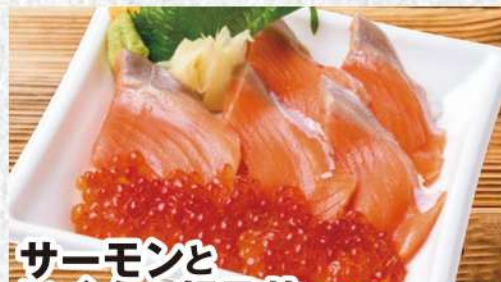
サーモンといくら親子丼 976円 (税込1055円) サーモンといくらの相性は抜群!