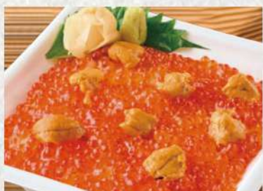
いくら雲丹丼 1822円 (税込1968円) たっぶりイクラと雲丹の贅沢コラボ