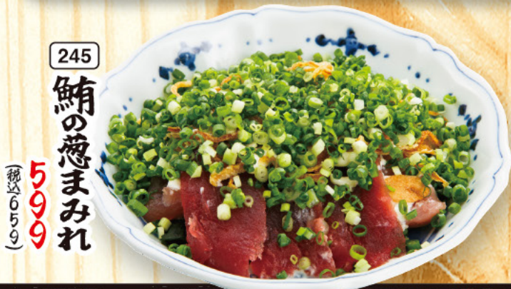
245 鯖の葱まみれ 599 (税込659)