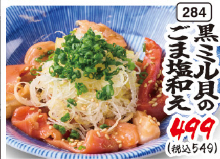
284 黒ミル貝の ごま塩和え