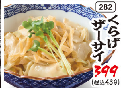
282 くらげ ザーサイ