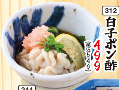
312 白子ポン酢 499 (税込549)