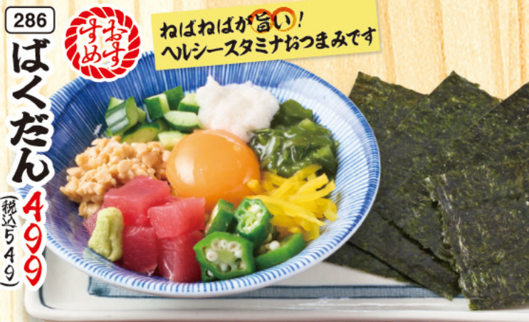
286 ばくだん 499 (税込549)