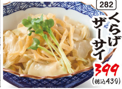
282 くらげ ザーサイ