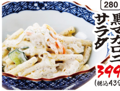
280 黒マカロニ サラダ