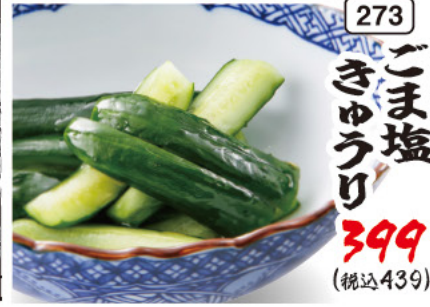
273 ごま塩 きゅうり