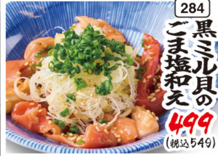
284 黒ミル貝の ごま塩和え