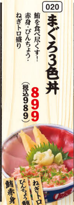
020 まぐろ3色丼 鮭を食べ尽くす! 赤身・びんちょう・ ねぎトロ盛り