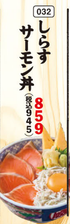
032 しらす サイモン丼 (税込945)