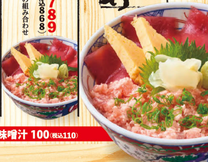
021 ねぎトロ丼 鮭赤身とねぎトロは、 鮭好きにはたまらない黄金の組み合わせ