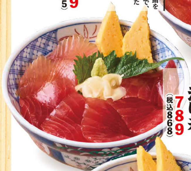
019 まぐろユツケ丼 コチュジャンベースのたれが 食欲をそそります