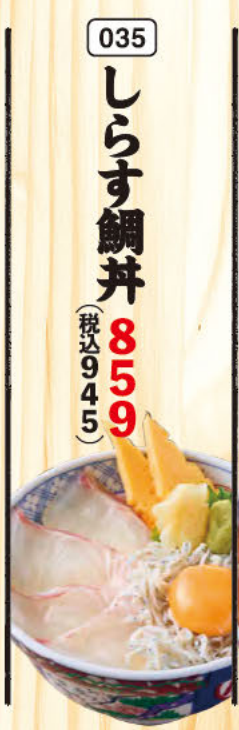
035 しらす鯛丼 (税込945)