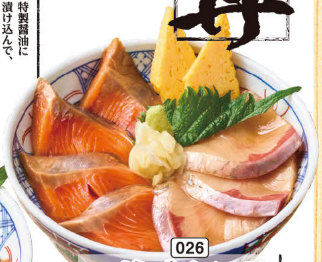
026 サイモンとブリの 漬り丼 漬り込むことで 渾然一体となった サイモンとブリの旨みを お楽しみください