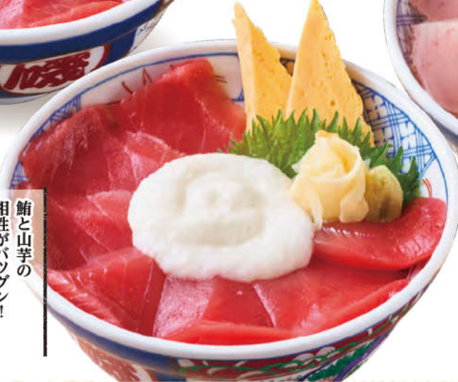
013 まぐろ とろろ丼 鮭と山芋の 相性がバツグン!