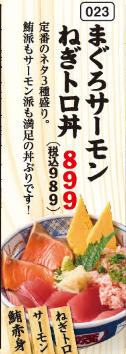
023 まぐろサーモン ねぎトロ丼 定番のネタ3種盛り。 鮭派もサーモン派も満足の丼ぶりです!