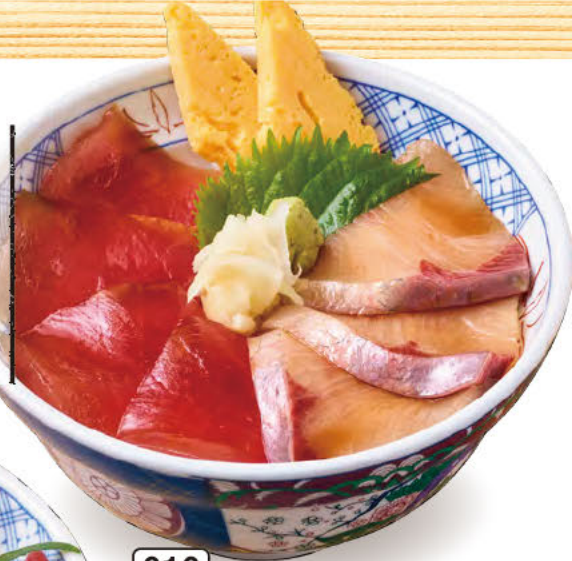
010 まぐろ 漬り丼 特製醤油に漬り込んで、 鮪のおいしさを存分に 引き出しました