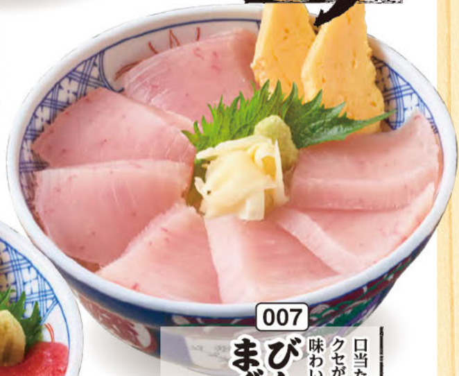
007 びんちょう まぐろ丼 口当たりの良さに加え、 クセが無くあっさりとした 味わいです