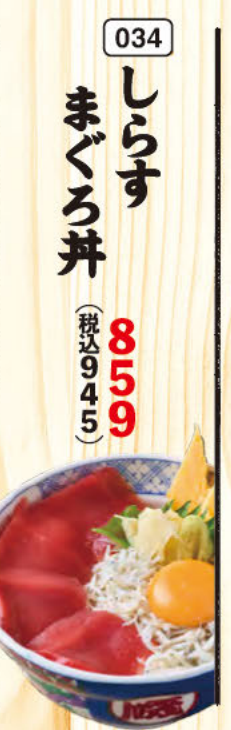
034 しらす まぐろ丼 (税込945)