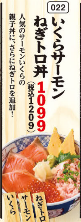
022 いくらサーモン ねぎトロ丼 人気のサーモンいけらの 親子丼に、さらにねぎトロを追加!