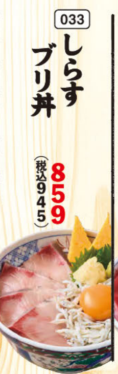
033 しらす ブリ丼 (税込945)