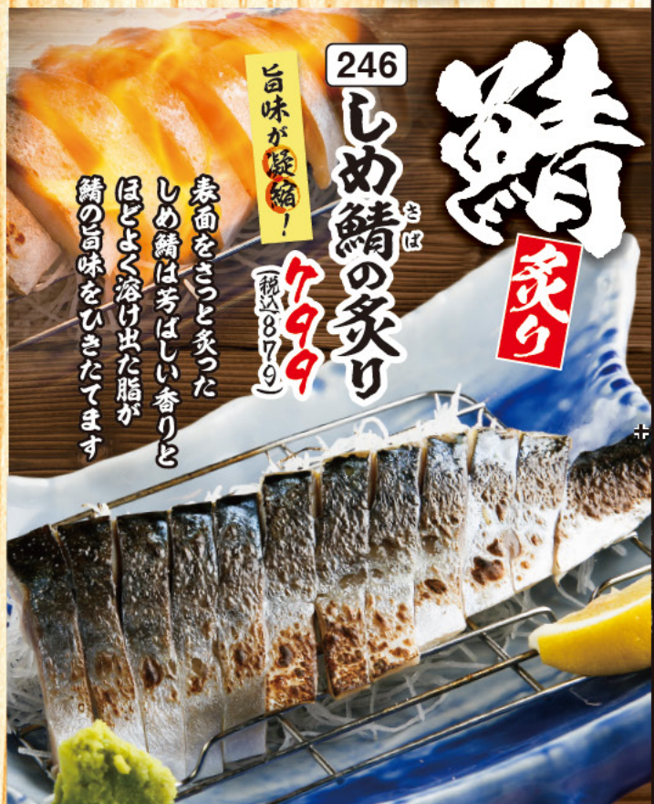
246 しめ鯖の炙り 799 (税込879) 旨味が凝縮！ 表面をさっと炙ったしめ鯖は芳ばしい香りとほとく溶け出た脂が鯖の旨味をひきたてます