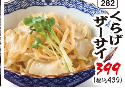
282 くらげ ザーサイ