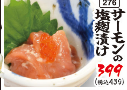
276 サーモンの塩麴漬