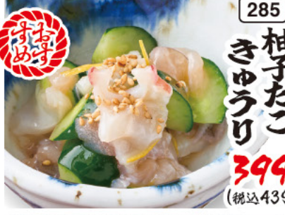
285 柚子たこ きゅうり