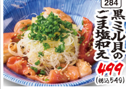
284 黒ミル貝の ごま塩和え