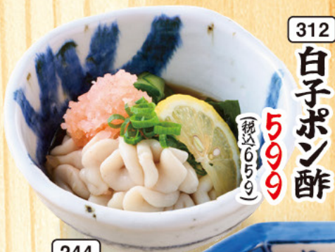
312 白子ポン酢 599 (税込659)