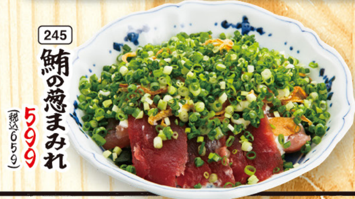
245 鮭の葱まみれ 599 (税込659)

表面をさっと炙ったしめ鯖は芳ばしい香りとほとく溶け出た脂が鯖の旨味をひきたてます