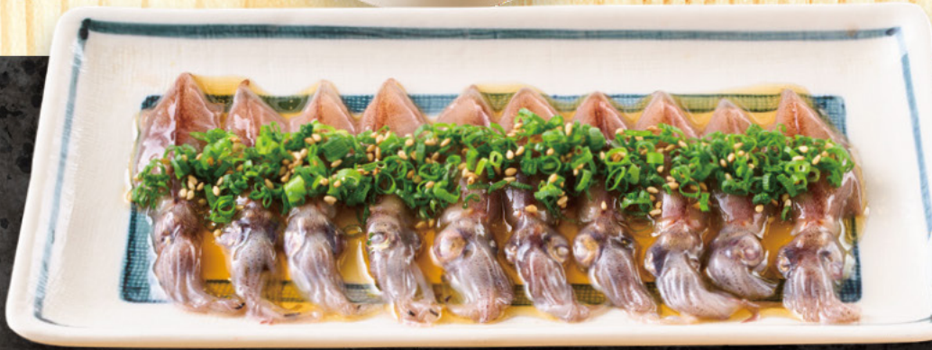
266 ホタルイカのレバ刺し風 699 (税込769)