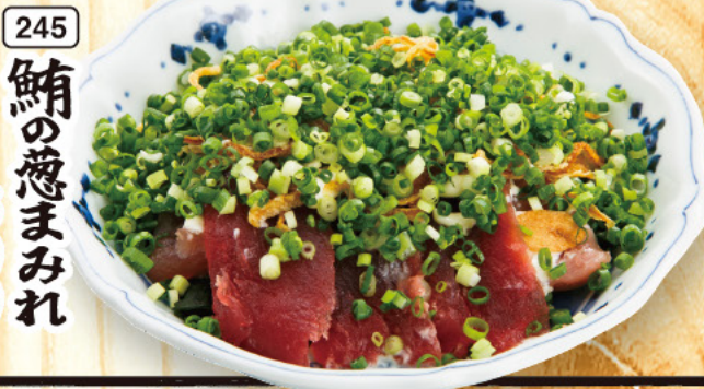
245 鯖の葱まみれ 599 (税込659)