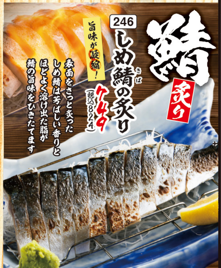
246 しめ鯖の炙り 449 (税込499)

旨味が凝縮! 表面をさっと炙ったしめ鯖は芳ばしい香りとほどよく溶け出た脂が鯖の旨味をひきたてます