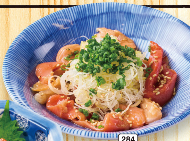
284 黒ミル貝のごま塩和え 399 (税込439)