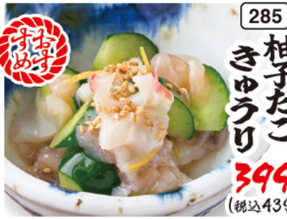
285 柚子たこ きゅうり