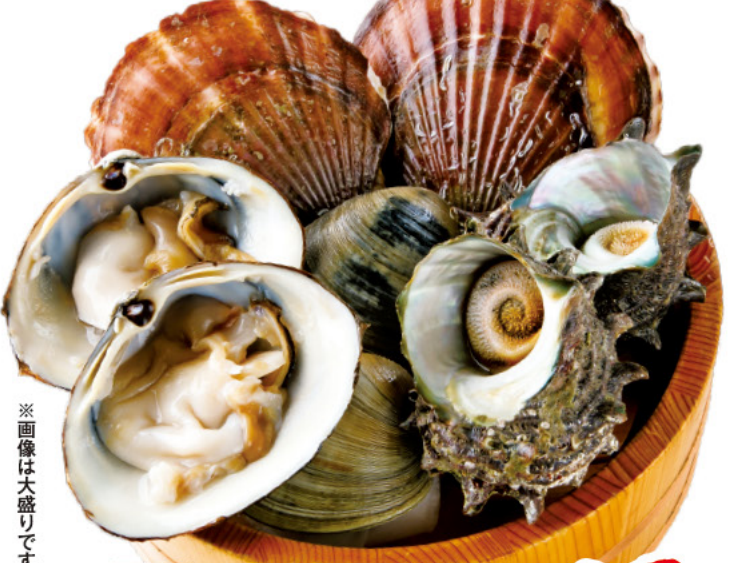
※画像は大盛りです