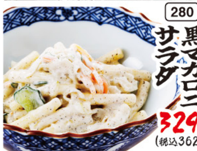
280 黒マカロニ サラダ