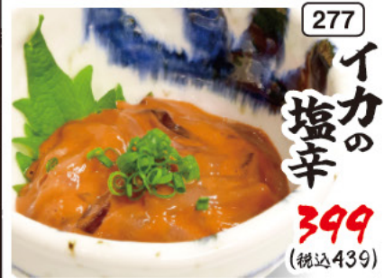
277 イカの 塩辛