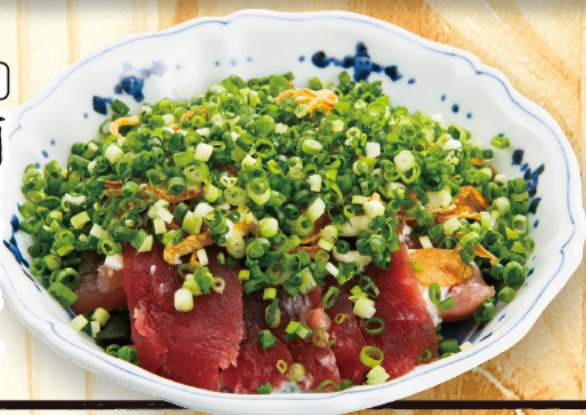
245 鯖の葱まみれ 599 (税込659)