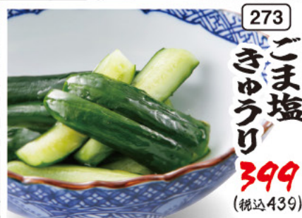
273 ごま塩 きゅうり