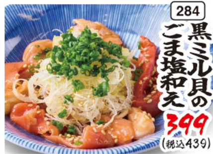
284 黒ミール貝の ごま塩和え