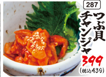
287 ワフ貝 チャンゾヤ