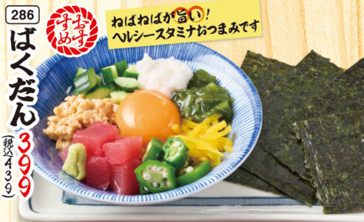
286 ばくだん 399 (税込439) ねばねばが旨い! ヘルシースタミナおつまみです