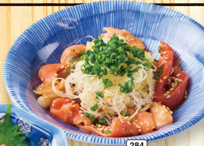
284 黒ミル貝の ごま塩和え 399 (税込439)