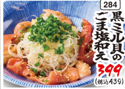
284 黒ミル貝のごま塩和え