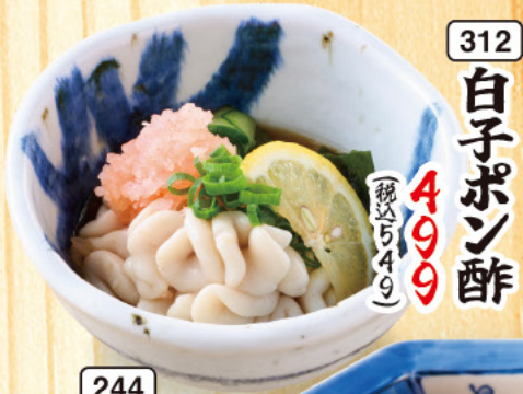
312 白子ポン酢 499 (税込549)