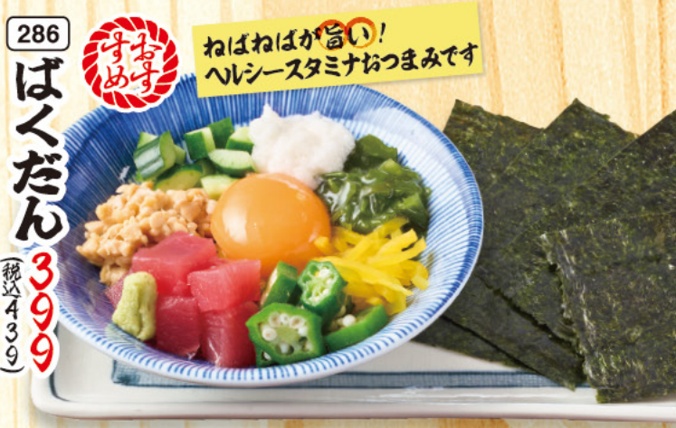
286 ばくだん 399 (税込439) ねばねばが旨い! ヘルシースタミナおつまみです