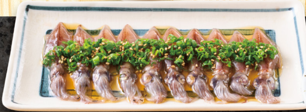
266 ホタルイカのレバ刺し風 599 (税込659)