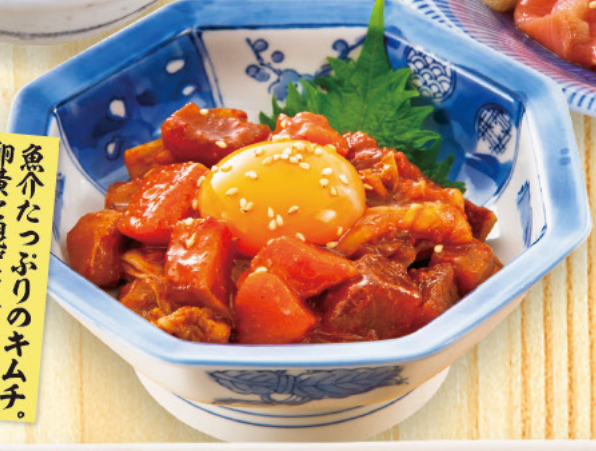
244 海鮮キムチエツケ 599 (税込659) 魚介たっぷりのキムチ。卵黄と混ぜてどうぞ!