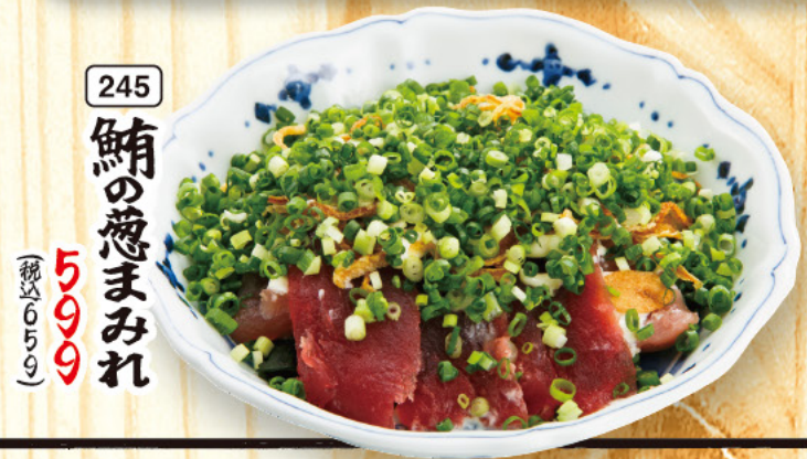
245 鯖の葱まみれ 599 (税込659)