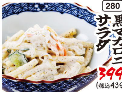
280 黒マカロン サラダ