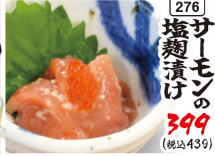
276 サーモンの 塩麴漬