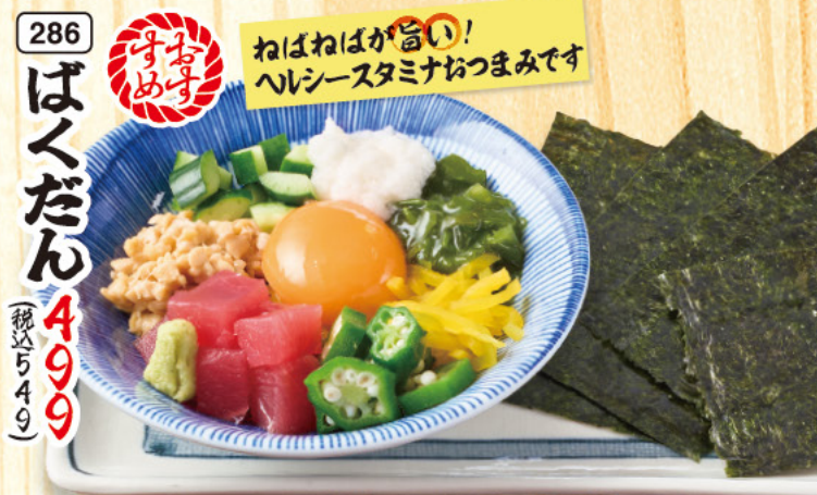
286 ばくだん 499 (税込549) ねばねばが旨い! ヘルシースタミナおつまみです