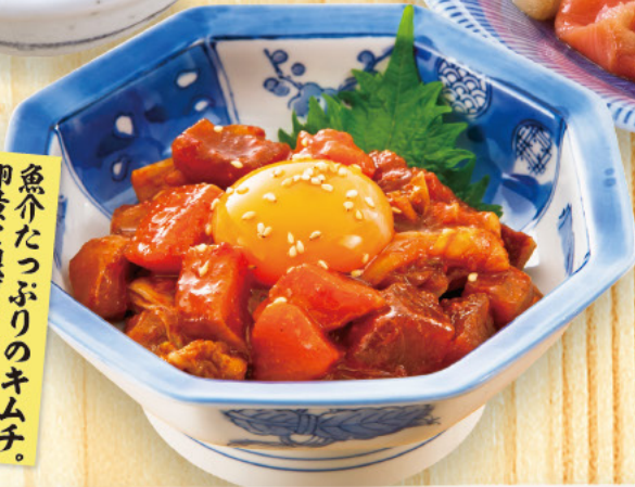
244 海鮮キムチエッグ 599 (税込659) 魚介たっぷりのキムチ。卵黄と混ぜてどうぞ!