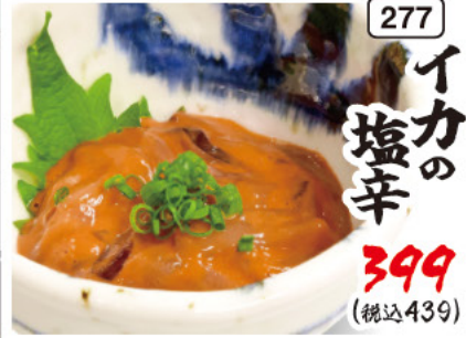
277 イカの 塩辛