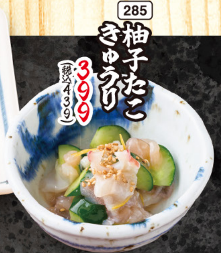
285 柚子たこ きゅうり