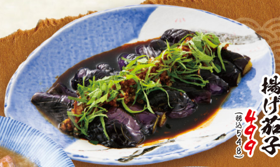
揚げ茄子 499 税込548