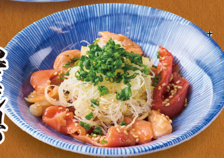
黒とル貝の ごま塩和え 499 税込548