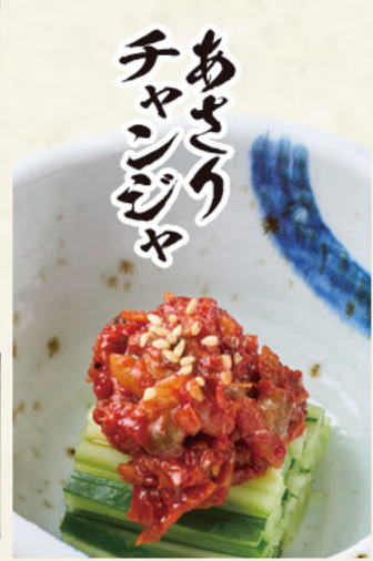
あさり チャンジャ