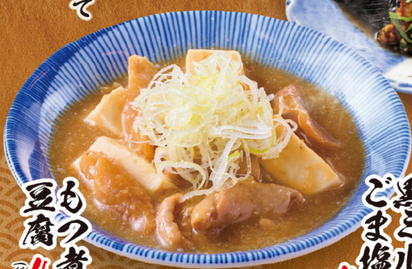
もの煮込み 豆腐 499 税込548