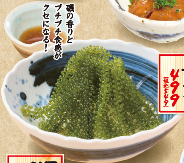
海ブドウ サラダ 499 (税込549)