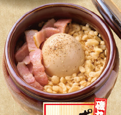
磯丸風 ホトケ サラダ 499 (税込549)