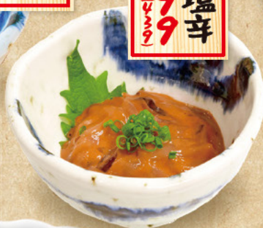
くまみ鰯 499 (税込549)