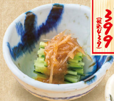
梅水晶 399 (税込449)