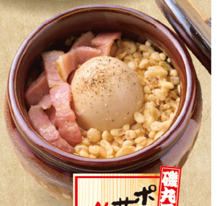
磯丸風 ポテッ サラダ 499 (税込549)