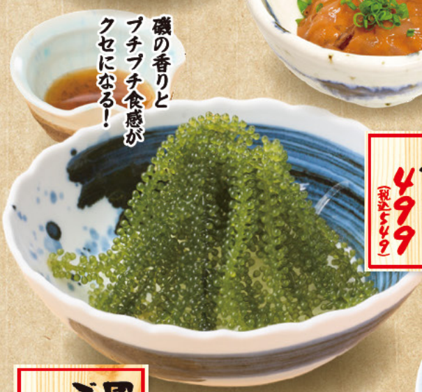
海ブドウ サラダ 499 (税込549)