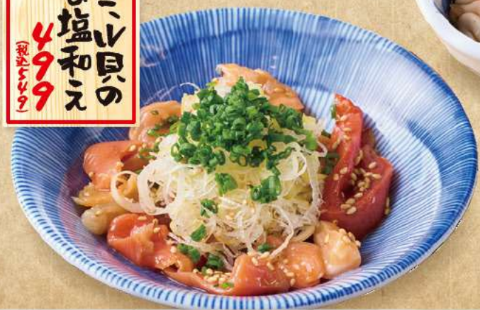
黒ミソ貝の なめ塩和え 499 (税込540)