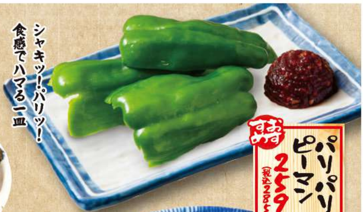
パリパリ ビーサン 259 (税込290)