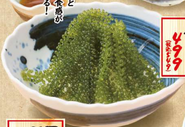
海ブドウ サラタ 499 (税込540)