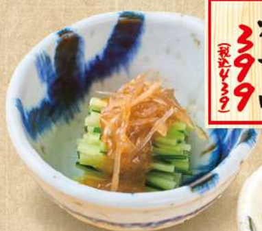
梅干品 399 (税込440)