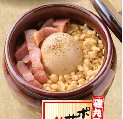
磯丸風 ポテッ サラタ 499 (税込540)