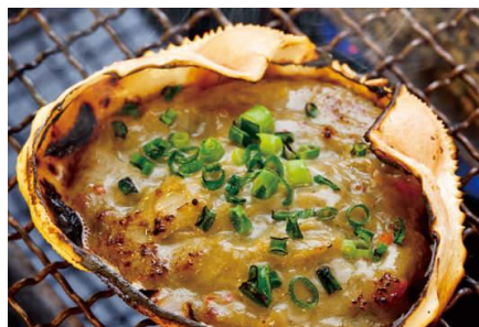
蟹味噌甲羅焼 499円(税抜価格)

新鮮な魚貝が楽しめるご宴会コースも ご用意しています！年末の忘年会にも是非磯丸水産へ！