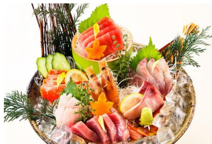
旬の刺身6点盛り 1,560円(税抜価格)